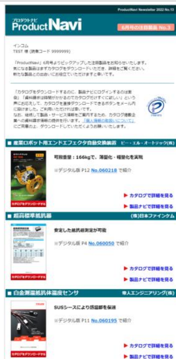
プロダクトナビHTMLメールイメージ