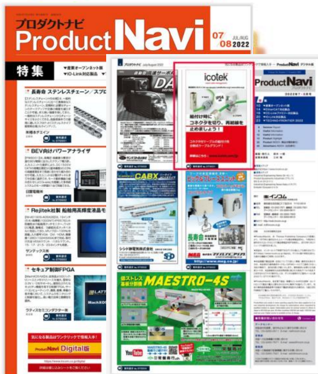
情報誌プロダクトナビ1/9広告イメージ